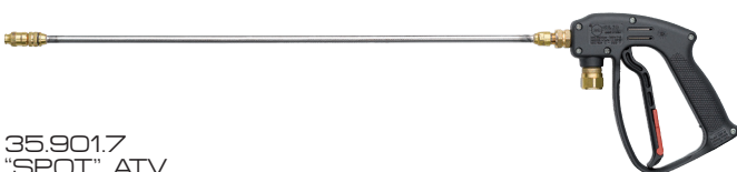
35.901.7 "SPOT" ATV