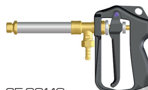
35.901.16 "SPOT" 300